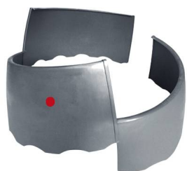
3 teilig 67 cm Ø