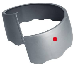
1 teilig 49 cm Ø